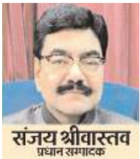
(यंग भारत न्यूज़)

लखनऊ। प्रदेश के मुख्यमंत्री योगी आदित्यनाथ आज बिजनौर के ऐतिहासिक धामपुर में एक बेहद आक्रामक और भावुक रूप में नजर आए। मुख्यमंत्री ने बिजनौर की धरती से न सिर्फ क्षेत्र को अरबों रुपये की विकास परियोजनाओं की सौगात दी, बल्कि पाकिस्तान से विस्थापित होकर आए 1,645 हिंदू परिवारों और 50 पूर्व सैनिकों को उनकी जमीन का 'भूमिधारी अधिकार पत्र' और प्रधानमंत्री आवास की चाबियां भी सौंपी।