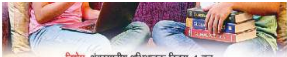
विशेष: अंतरराष्ट्रीय अभिभावक दिवस, 1 जून