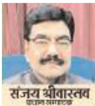
(यंग भारत न्यूज़)

लखनऊ। उत्तर प्रदेश में औद्योगिक विकास को नई दिशा देने और निवेश को बढ़े शहरों से आगे छोटे जिलों तक पहुंचाने के लिए योगी सरकार ग्रांड ब्रेकिंग सेरेमनी (GBC-5.0) की तैयारियों में जुट गई है। इस बार सरकार की रणनीति सिर्फ लखनऊ, नोएडा, गाजियाबाद या कानपुर जैसे बड़े औद्योगिक केंद्रों तक सीमित नहीं है, बल्कि छोटे शहरों, पिछड़े जिलों, पूर्वांचल और बुंदेलखंड जैसे क्षेत्रों में भी निवेश की मजबूत बुनियाद तैयार करने पर जोर दिया जा रहा है।