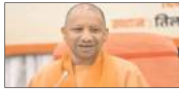
आए। इस वक्त यूपी के सियासी हलकों में सबसे बड़ी चर्चा और सरसंसे इस बात को लेकर बना हुआ है कि क्या ग्राम पंचायतों का कार्यभार इस बार भी मौजूदा ग्राम प्रधानों के हाथों में ही रहेगा? चर्चा है कि सरकार इस बार ग्राम प्रधानों को ही 'प्रशासक' (एडमिनिस्ट्रेटर) के रूप में नियुक्त कर सकती है। सूबे के पंचायती राज मंत्री ओम प्रकाश राजभर लगातार सार्वजनिक तौर पर यह बयान दे रहे हैं कि मौजूदा ग्राम प्रधानों को ही गांवों का प्रशासक बनाया जाना चाहिए। विभागीय स्तर पर भी इस खास प्रस्ताव पर बहुत ही गंभीरता से फाइलें दौड़ाई जा रही हैं।

उत्तर प्रदेश में मौजूदा ग्राम पंचायतों का निर्धारित कार्यकाल आगामी 26 मई को समाप्त होने जा रहा है। इस तारीख के बाद सभी ग्राम पंचायतों औपचारिक रूप से पूर्व घोषित हो जाएंगी। कार्यकाल खत्म होने की स्थिति को देखते हुए पंचायतों के रोजमर्रा के कामकाज और संचालन के लिए सरकार बैंकअप प्लान यानी वैकल्पिक व्यवस्था पर गंभीरता से विचार कर रही है। योगी सरकार की पूरी कोशिश है कि कार्यकाल खत्म होने के बाद भी ग्रामीण इलाकों की व्यवस्था में कोई प्रशासनिक शून्य (गैप) पैदा न हो और गांवों में चल रहे विकास कार्यों को रफ्तार में किसी भी तरह की रूकावट न