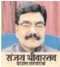
(यंग भारत न्यूज़)

लखनऊ। योगी सरकार युवाओं को लगातार एक के बाद एक सौगात रही है। अब योगी सरकार राज्य की बेटियों को बड़ा तोहफा देने जा रही है। सीएम योगी ने ये कदम बेटियों की शिक्षा, सुरक्षा उन्हें आत्मनिर्भर बनाने के लिए उठाया है। जिसके तहत योगी सरकार राज्य के उच्च शिक्षण संस्थानों में पढ़ाने वाली 70 हजार से अधिक मेधावी छात्राओं को मुफ्त इलेक्ट्रिक स्कूटी की सौगात देने जा रही है।