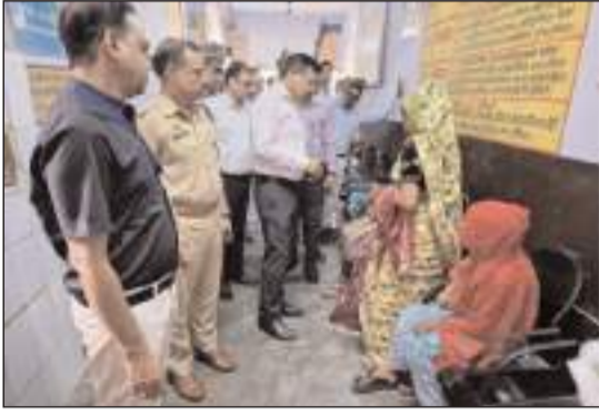
दवाइयां निःशुल्क उपलब्ध हो रही हैं और चिकित्सकों द्वारा समुचित उपचार भी