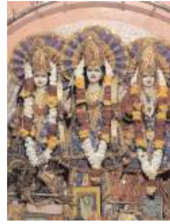
देशी - विदेशी फूलों से आकर्षक सजाया गया। श्रद्धालुओं ने माता जानकी की