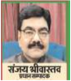
(यंग भारत न्यूज़)

गंगा एक्सप्रेसवे के साथ भारत के 'एक्सप्रेस प्रदेश' में जुड़ा नया अध्याय