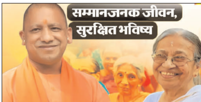
सम्मानजनक जीवन, सुरक्षित भविष्य

वृद्धाश्रमों में रहने वाले बुजुर्गों के लिए सरकार ने विशेष डाइट चार्ट तैयार किया है, जिसमें सुबह के नाश्ते से लेकर रात्रि भोज तक हर दिन अलग-अलग और पौष्टिक व्यंजनों की व्यवस्था है। नाश्ते में दलिया, पोहा और