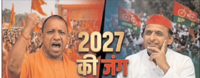
अखिलेश की राह आसान या बढ़ेगी मुसीबत?

यह घोषणा उस समय आई है जब दिल्ली से लेकर लखनऊ तक नेतृत्व परिवर्तन की चर्चाएं गर्म थीं। बीजेपी ने साफ कर दिया है कि जिस चेहरे ने उत्तर प्रदेश को 'उत्तम प्रदेश' बनाया और राज्य में एक सशक्त कानून-व्यवस्था (Law and Order) स्थापित की, वही 2027 में पार्टी का सेनापति होगा। इस बड़े पेलान ने न सिर्फ बीजेपी के भीतर के संशय को खत्म किया है, बल्कि विपक्ष के लिए भी नई धारा खोल दी है।