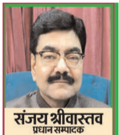
(यंग भारत न्यूज़)

यूपी की सियासत में शुरू हुआ 'सबसे बड़ा' खेल