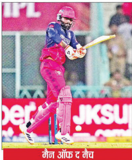
नैन ऑफ द मैच