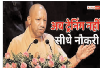
अब ट्रेनिंग नहीं सीधे नौकरी

बैठक में यह स्पष्ट किया गया कि योगी सरकार स्किल डेवलपमेंट को प्रदेश की आर्थिक प्रगति का प्रमुख आधार मानते हुए इसे उद्योगों से जोड़ने की दिशा में लगातार कार्य कर रही है। आईटीआई सुधार, इंडस्ट्री पार्टनरशिप और आधुनिक कोर्सों के माध्यम से प्रदेश के युवाओं को रोजगार योग्य बनाकर बड़े पैमाने पर रोजगार सृजन का लक्ष्य निर्धारित किया गया है। प्रदेश में तेजी से बढ़ते औद्योगिक निवेश और एमएसएमई सेक्टर के विस्तार को देखते हुए स्किल डेवलपमेंट को प्रोत्साहन दिया जा रहा है। ऐसे में कौशल विकास कार्यक्रमों को रोजगार से जोड़ने की यह पहल उत्तर