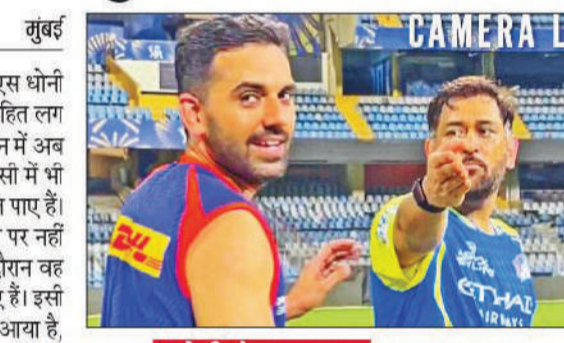
धोनी ने क्या कहा

मुंबई। फैंस 2026 आईपीएल सीजन में एमएस धोनी को देखने के लिए बहुत ज्यादा उत्साहित लग रहे हैं। चेन्नई सुपर किंग्स ने इस सीजन में अब तक छह मैच खेले हैं, जिनमें से किसी में भी धोनी चोट की वजह से नहीं खेल पाए हैं। हालांकि धोनी असली मैचों में मैदान पर नहीं दिखे हैं, लेकिन प्रैक्टिस सेशन के दौरान वह लगातार मैदान पर नजर आए हैं। इसी बीच, धोनी का एक वीडियो सामने आया है, जिसमें वह एक खास 'बिहारी' अंदाज में बात करते दिख रहे हैं। मुंबई इंडियंस ने धोनी का यह वीडियो सोशल मीडिया पर शेयर किया है, जिसमें वह एमआई के तेज गेंदबाज दीपक चहल से बात करते दिख रहे हैं। वीडियो में, जैसे ही धोनी की नजर कैमरे पर पड़ती है, वह अपने जाने-पहचाने बिहारी अंदाज में बात करना शुरू कर देते हैं। फैंस को माही का यह खास अंदाज बहुत पसंद आता है।