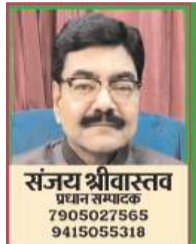
(यंग भारत न्यूज़)

प्रदेश में 2027 के विधानसभा चुनाव की तैयारियों ने अब रफ्तार पकड़ ली है। मुख्यमंत्री योगी आदित्यनाथ के मंत्रिमंडल में विस्तार की चर्चाएं तेज हो गई हैं, जिसकी संभावना इसी सप्ताह जताई जा रही है। राजनीतिक गलियारों में हलचल है कि यह विस्तार केवल प्रशासनिक फेरबदल नहीं, बल्कि आगामी चुनावों को ध्यान में रखकर किया जाने वाला एक बड़ा 'सोशल इंजीनियरिंग' प्रयोग होगा।