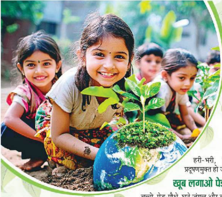
हरी-भरी, स्वच्छ और प्रदूषणमुक्त हो जाएगी।