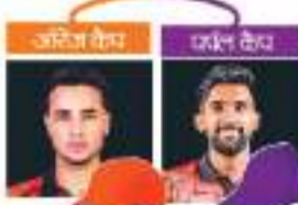
अभिषेक शर्मा और इरफान खान