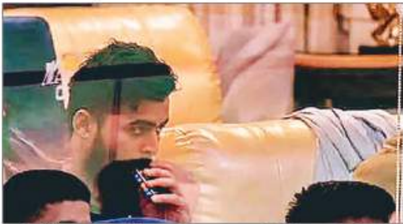
दूसरी बार विवाद में रियान पराग

राजस्थान टैलेंट्स के कप्तान रियान पराग संसदघर के पंचांग क्रिकेट के खिलाफ मुंबई में खेले गए आईसीसी नेच के दौरान ड्रेसिंग रूम में वेपिंग (ई-सिगरेट का इस्तेमाल करना) करते हुए टीवी कैमरा में कैच होने के बाद विवादास्पद हो गए हैं। भारत सरकार ने 2019 में ई-सिगरेट पर प्रतिबंध लगा दिया था, जिसके इस्तेमाल को बंद करने और निगरानी रखना बाध्यकारी है। आईसीसी ने मुंबई में खेले गए अंतरराष्ट्रीय मैच के दौरान रियान पराग को वेपिंग करते हुए पकड़े जाने का वीडियो देखा था। वेपिंग एक प्रकार का इलेक्ट्रॉनिक सिगरेट है, जो सिगरेट के समान दिखता है, लेकिन इसमें टैबैक नहीं होता है। इसके बजाय इसमें निकोटाइन और कार्बन डायऑक्साइड का मिश्रण होता है। आईसीसी ने रियान पराग को वेपिंग करते हुए पकड़े जाने का वीडियो देखा था। वेपिंग एक प्रकार का इलेक्ट्रॉनिक सिगरेट है, जो सिगरेट के समान दिखता है, लेकिन इसमें टैबैक नहीं होता है। इसके बजाय इसमें निकोटाइन और कार्बन डायऑक्साइड का मिश्रण होता है।