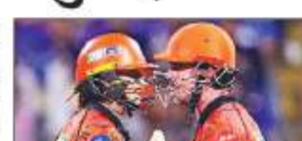
हेनरिक क्लासेन ने 100 रन का शतक बनाया

मुंबई (भाषा)। ट्वेंटी ट्वेंटी हेड और हेनरिक क्लासेन के शानदार अर्धशतक से सनराजर्स हैदराबाद ने इंडियन प्रीमियर लीग में बुधवार को यहां खेले गए मैच में मुंबई को 6 विकेट से हराया।